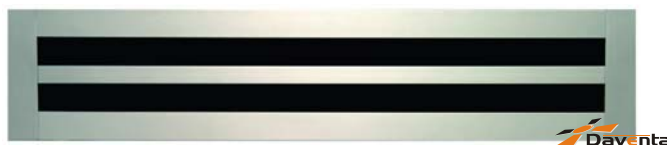
Cena netto nawiewnika